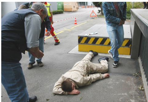
Impression aus dem IVR-Kurs