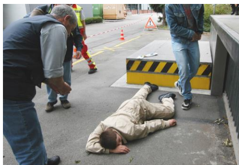
Impression aus dem IVR-Kurs